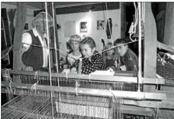
Arbeit am Webstuhl