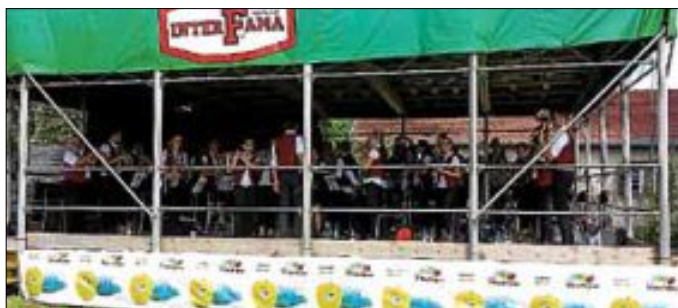
Auftritt der Kapelle

Vielen Dank an die Organisation der Reise und für die Organisation des ausgiebigen Autobahnvespers.