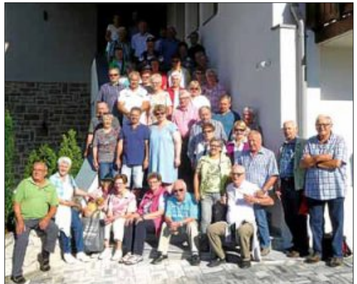
Gruppenbild vor Hotel Waldhof zu Percha