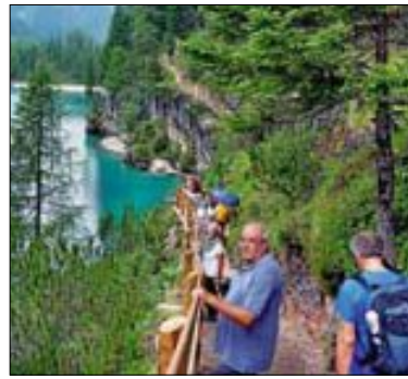
Rundgang um den Pragser Wildsee

Anschließend wurde eine sehr schöne Rund-Wandlung um den Pragser Wildsee mit einer Stippvisite zur Grünwaldalm durchgeführt. Der Rückreisetag führte über das Hotel "Zur Brücke" zu Mittewald im Eisacktal, wo man Tiroler Schinken und Brot einkaufte, über den Brenner, Zirler Berg zum Klosterhotel Ettal, wo man sich stärkte. An Augsburg vorbei ging es