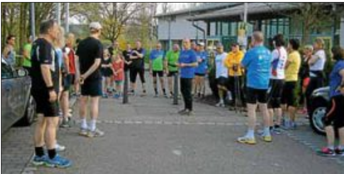
Großer Andrang bei der Saisonöffnung und dem Start des Anfängerkurses

Alle, die Lust auf das Joggen in der Gemeinschaft haben, sind jederzeit herzlich willkommen! Anfänger, Hobbyläufer und Marathonis können bei uns in verschiedenen Leistungsgruppen mitlaufen. Auch Nordic Walker können sich uns gern anschließen. Treffpunkt: Immer mittwochs um 19 Uhr an der Sporthalle in Oberbrüden.